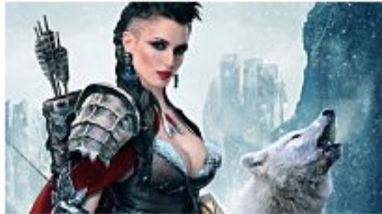
Stormfall: Kostenloses und süchtig machendes Strategiespiel!