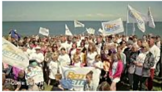
Fehmarn: Viel Unruhe im Ferien-Paradies