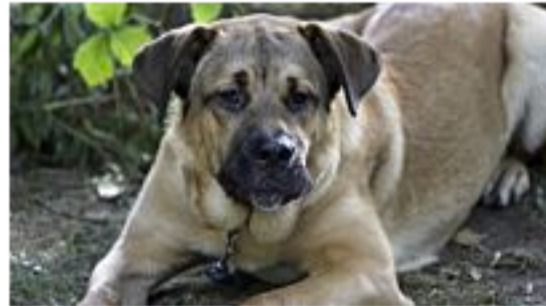
9 ungewöhnliche Hunderassen