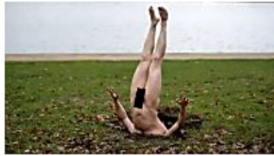
Kurios: Aktionskünstler gräbt sich nackt in Hamburg ein