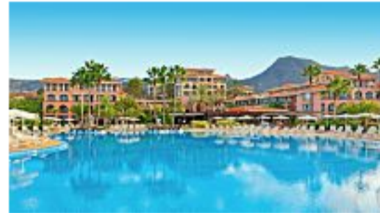
Die zehn besten All-Inclusive-Hotels in Europa