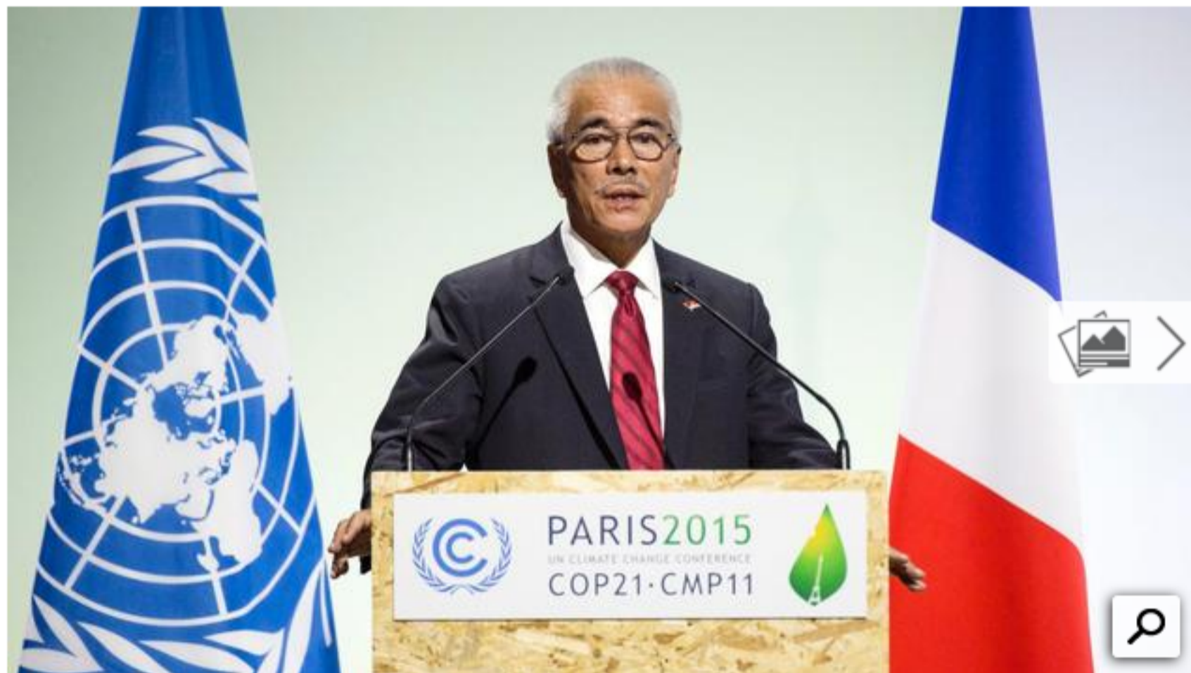
Kiribatis Präsident Anote Tong am Montag bei seiner Rede während der UN-Klimakonferenz in Paris.