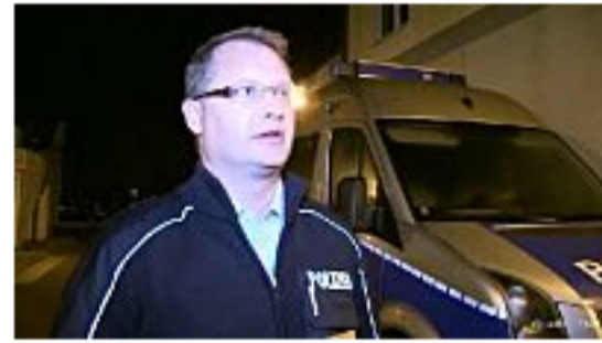
Massenschlägerei in Flüchtlingsunterkunft